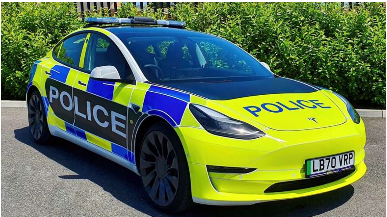
Tesla Model 3 med blå blink og sirener