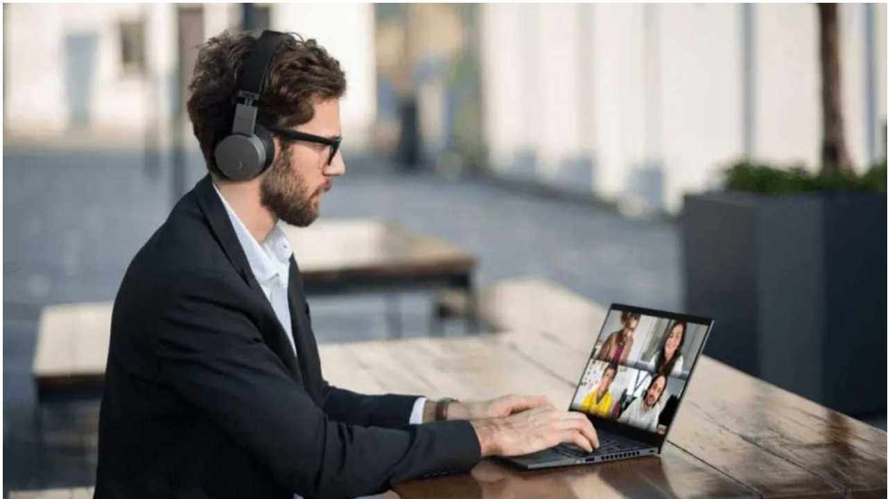
Arbejdsgiveren skal betale for grøn omstilling