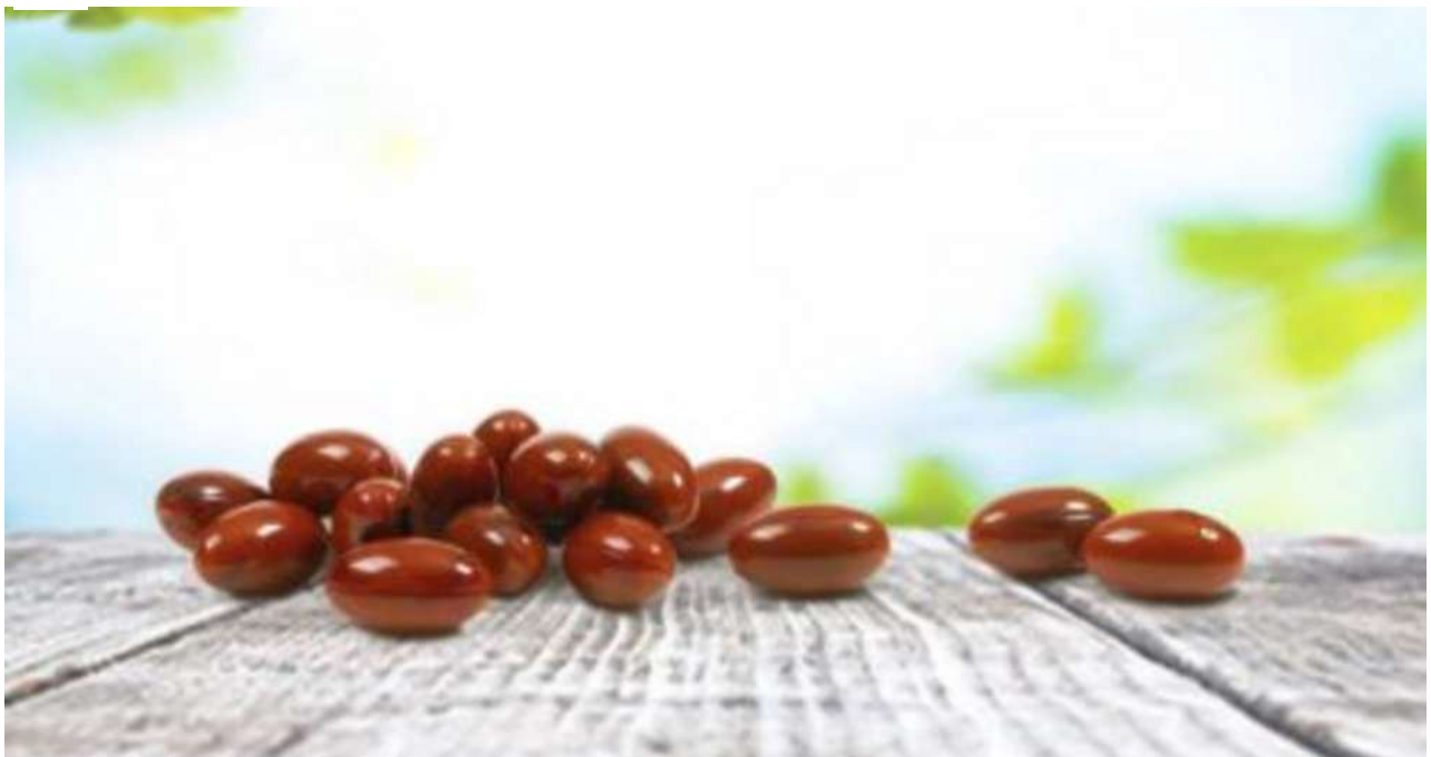
Sådan virker et af Nordens mest populære kosttilskud