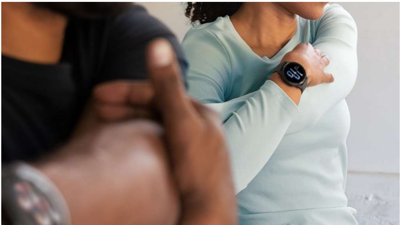
TEST: Garmin Venu 2 – Det trygge valg